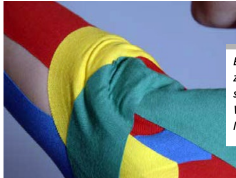
Bei Schulterschmerzen kann es hilfreich sein, Blockaden und Verspannungen zu lösen.

Schmerztherapie nachgewiesen. In beiden Studien wurde die Methode außerdem mit der Krankengymnastik verglichen. Hinsichtlich der Nachhaltigkeit schnitt die Medi-Taping®-Methode deutlich besser ab.