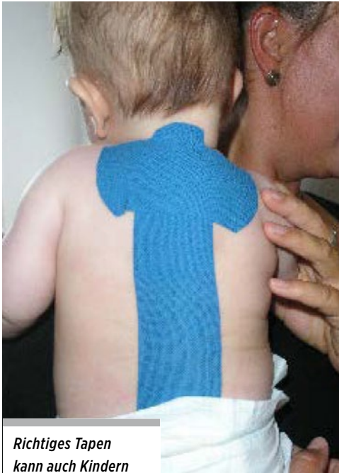
Richtiges Taping kann auch Kindern mit kopfgelenkinduziertem Symmetriesyndrom helfen.