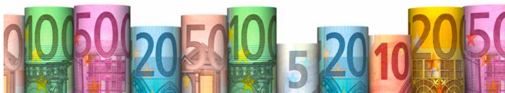
Tab. 1: Vergütungsübersicht Knappschaft HZV-Vertrag Sachsen