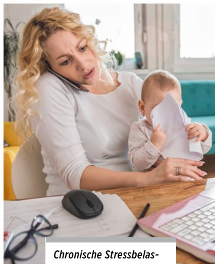
Chronische Stressbelastung kann zur Entwicklung teils schwerer Erkrankungen führen.

Bringt man nun Probanden im Laborversuch (simulierte Prüfungssituation in Form des Trierer Stresstestes) in eine stressbedingte Energiemangelsituation, bei der nach vorausgehender Aktivierung der Kortisol- und Adrenalinausschüttung die peripheren Depots verbraucht werden, kommt es typischerweise zu zerebralen Ausfallsymptomen, die man unter dem Begriff Neuroglukopenie zusammenfasst. Zu